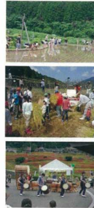
棚田保全（さが棚田ネットワーク）

加入市町数は17市町 他に、藤野地区、江里山地区、水土里（みどり）ネットさが（佐賀県土地改良事業団体連合会）、佐賀県が加入。