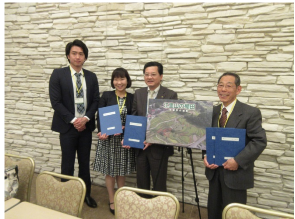
江里山の棚田関係者 （右から原口会長、福島社長、ひらまつ病院様）