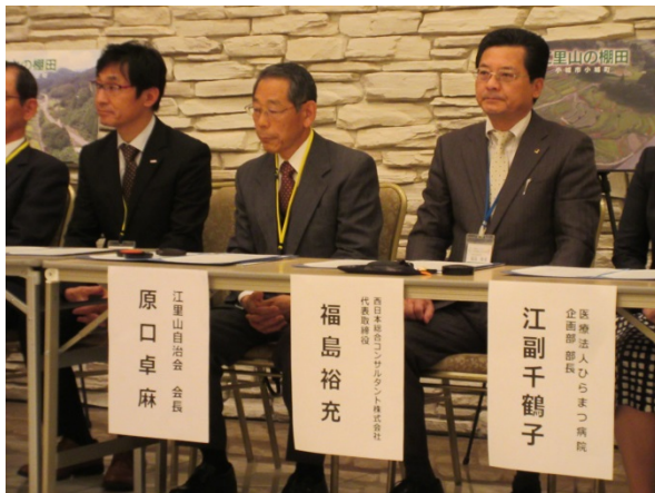
江里山の棚田（原口会長）と福島社長（右端）