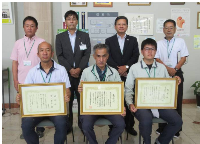
記念写真（手前：測量G 後方：役員）