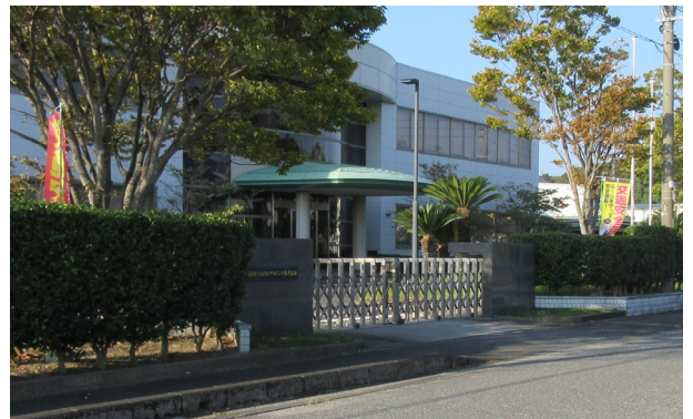
社屋周辺に交通安全旗（8本）