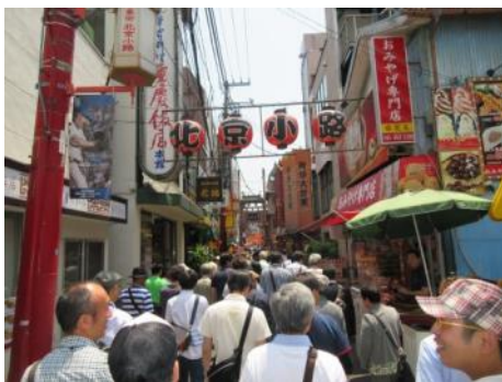
横浜・中華街散策