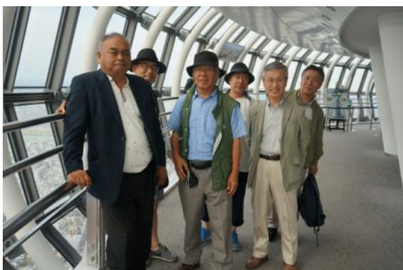
スカイツリー第2展望台