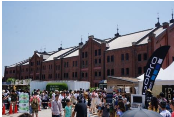
横浜・赤レンガ館