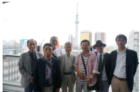
浅草・産業センター・ スカイツリーをバックに