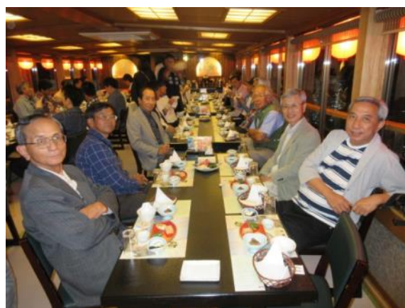
隅田川・屋形船 (夕食・遊覧観光)