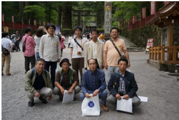
日光・東照宮 観光