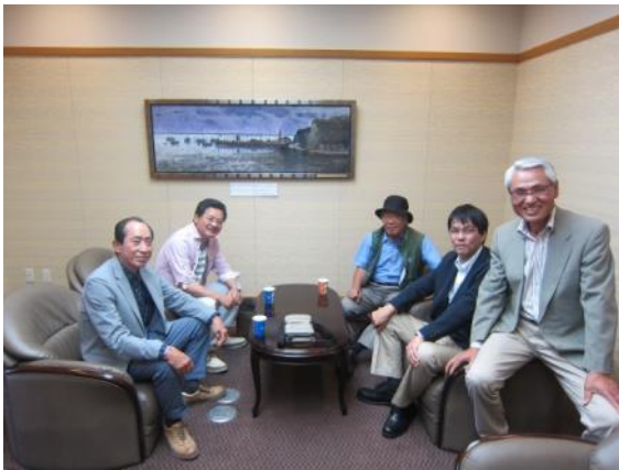
いざ・出発（ 於：佐賀空港：待合室）