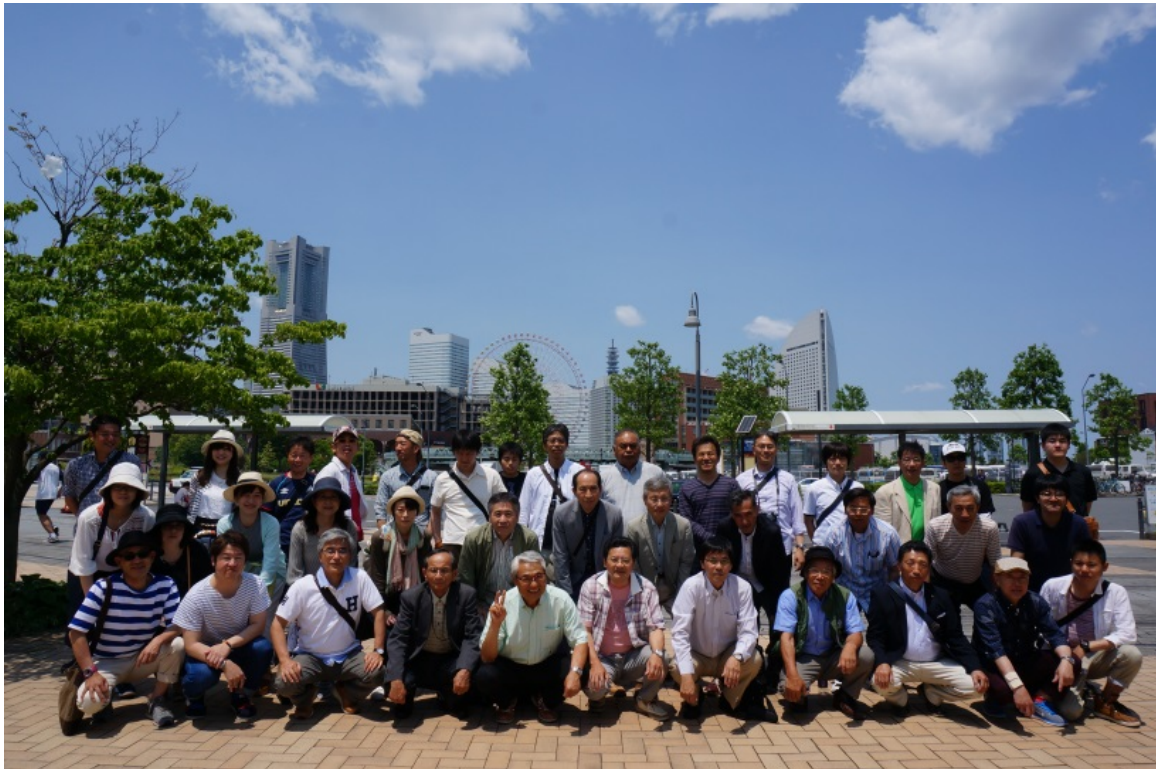
旅行集合写真（後方は横浜ランドマークタワー）