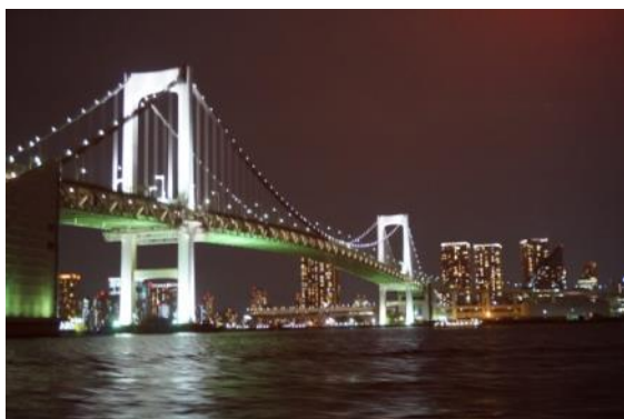
隅田川 屋形船 レインボブリッジ夜景