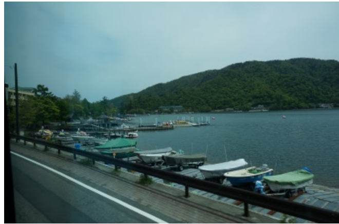
中禅寺湖（水面海拔標高：1, 269m）