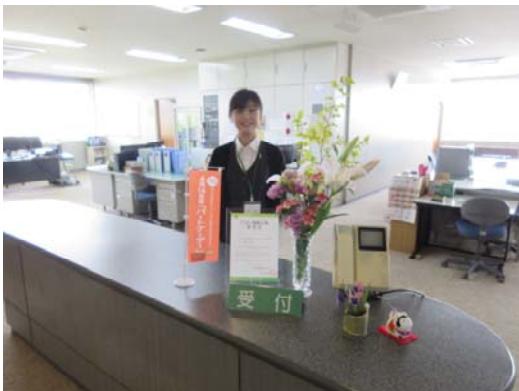
←パートナーデーのぼり旗（小） 2階受付