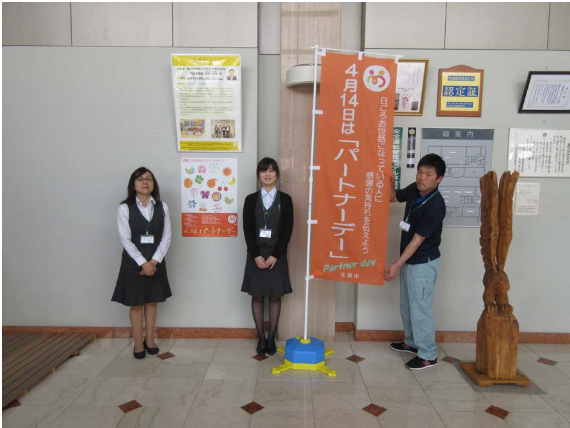
パートナーデーのぼり旗、ポスター掲示（当社玄関ホール）