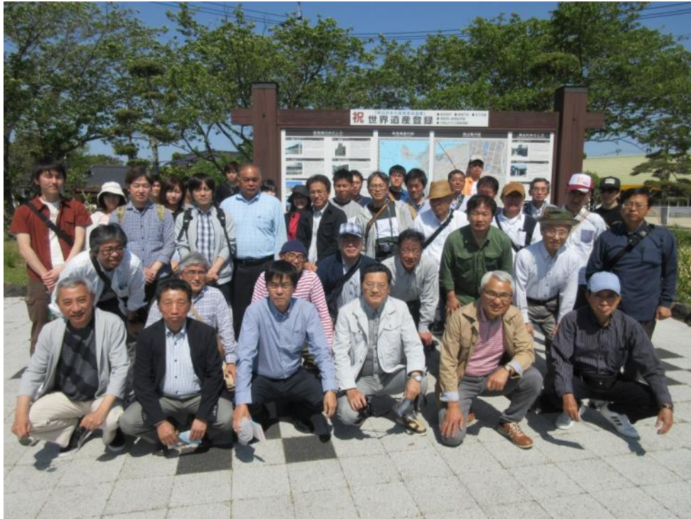
(世界遺産登録：萩城下町)