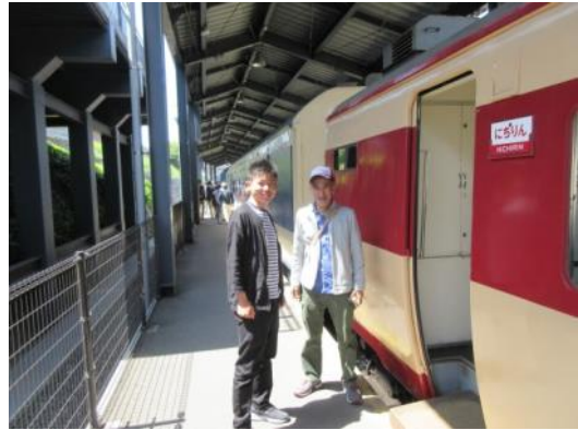
(下関・九州鉄道記念館)