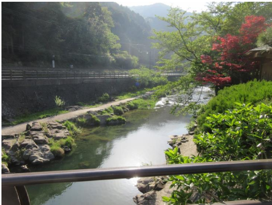
(5つ星の宿 湯本温泉・大谷山荘)