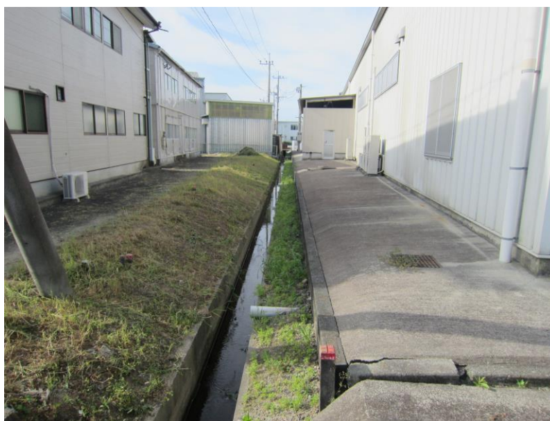
(↑ 下和泉水路 草刈り清掃作業後)