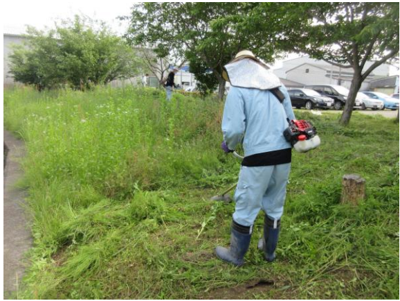
(↑ 桜公園 エンジン移動型草刈機作業)