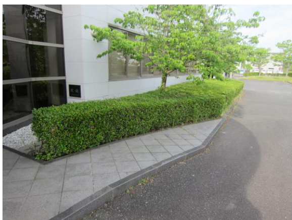
(↑ 玄関前・生垣 剪定前)