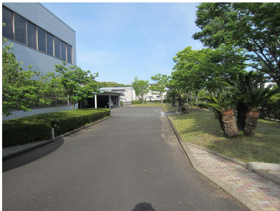
(↑ 玄関前庭・生垣、草刈り作業後)