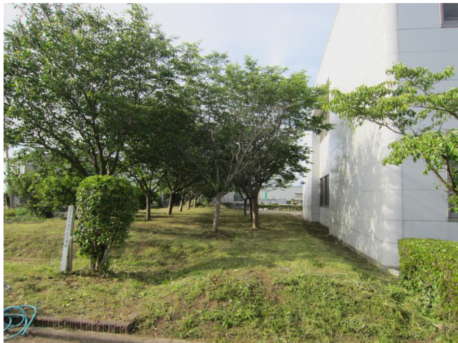
(↑ 社屋東側 桜公園 草刈り作業後)