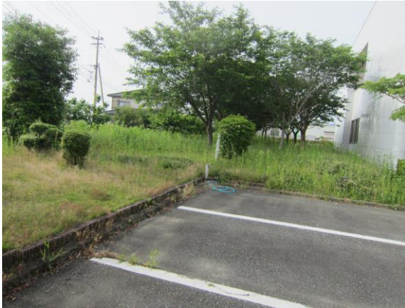
(↑ 社屋東側 桜公園・作業前)