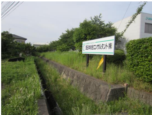
(↑ 上和泉水路、清掃草刈り前)