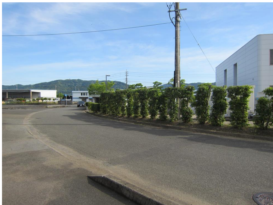
(↑ 社屋南側 変電設備所回り 榿の木・生垣剪定後)