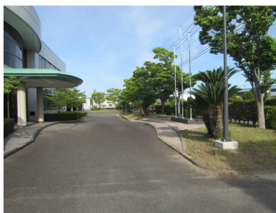
(↑ 玄関前庭・草刈り作業後)