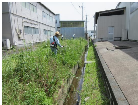
(↑ 下和泉水路、草刈り作業)