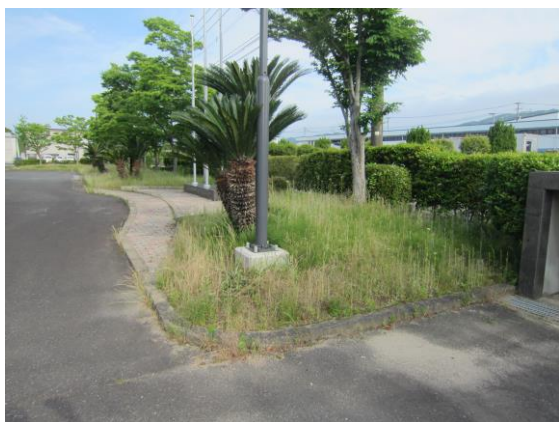
(↑ 玄関前庭・作業前)