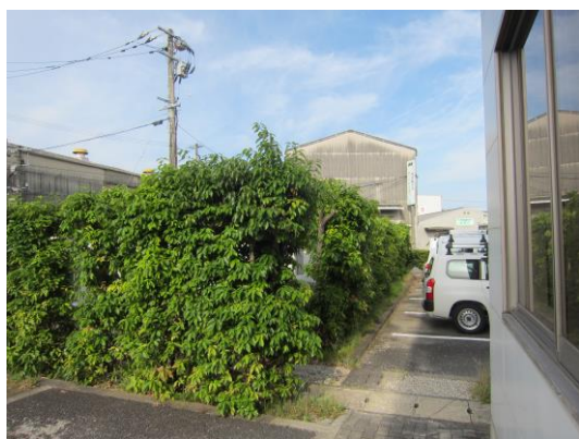
(↑社屋南側 変電設備所回り 生垣剪定前)