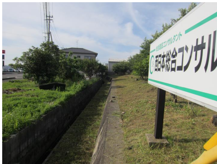
(↑ 上和泉水路草刈り作業後)