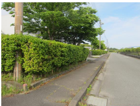
(↑社屋玄関 北側市道・山茶花生垣 剪定前)