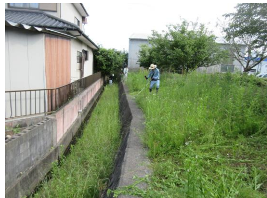
(↑ 上和泉水路、清掃草刈り作業)