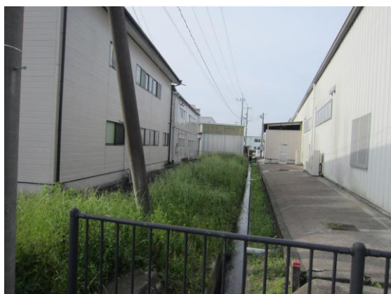
(↑ 下和泉水路 草刈り清掃前)