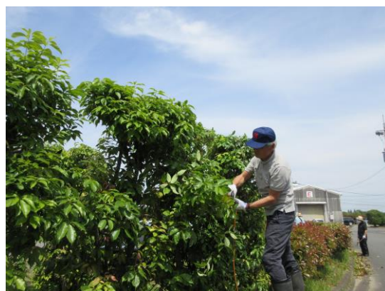
(↑ 同左 榿の木・生垣剪定作業)