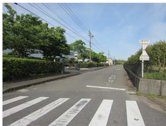
(↑社屋玄関 山茶花生垣 剪定後)